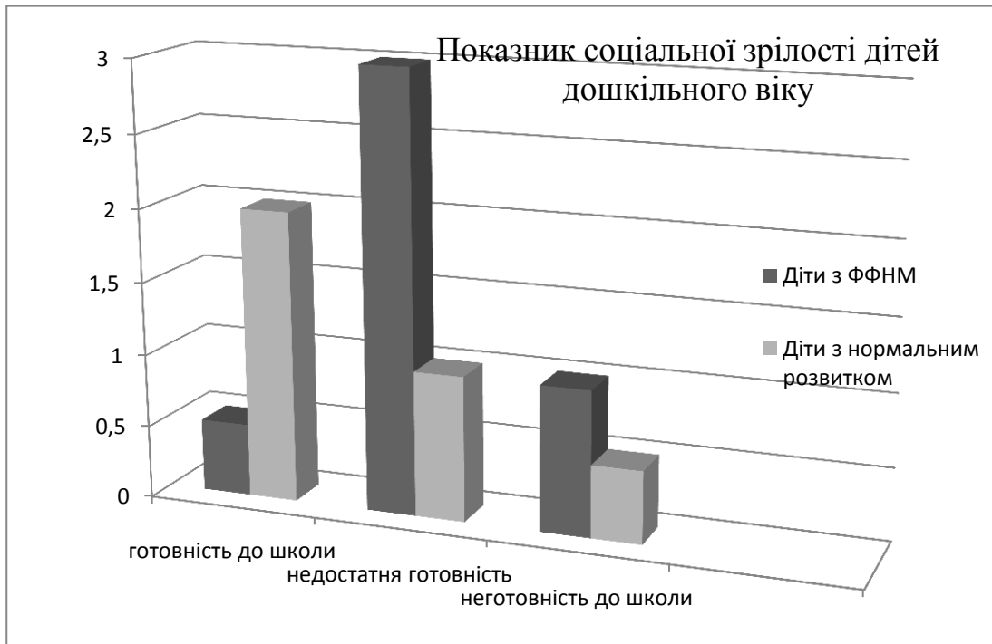
Рис. 2 Показник соціальної зрілості дітей дошкільного віку в нормі та при порушеннях мовлення (експертна оцінка)

Тож, ґрунтуючись на отриманих результатах експертної оцінки, виявлено, що у дітей з фонетико-фонематичним недорозвитком мовлення показник соціальної зрілості дещо нижчий, ніж у дітей із типовим розвитком. Тобто, діти з порушеннями мовлення уникають контактів із дорослим, важко встановлюють товариські стосунки з однолітками, не вміють діяти самостійно, в деяких випадках орієнтуються лише на власні інтереси, тоді як діти з типовим розвитком більш активні, легко входять у контакт із дорослим та з дітьми, вміють взаємодіяти з однолітками, можуть виявляти якості лідера, беруть активну участь у колективних іграх, визнають та дотримуються правил поведінки в групі та можуть контролювати свою поведінку. Перераховані критерії дуже важливі для навчання в школі, оскільки шкільне життя передбачає наявність самоконтролю, і вміння взаємодіяти з однолітками та дорослим, і вміння дотримуватися правил поведінки.