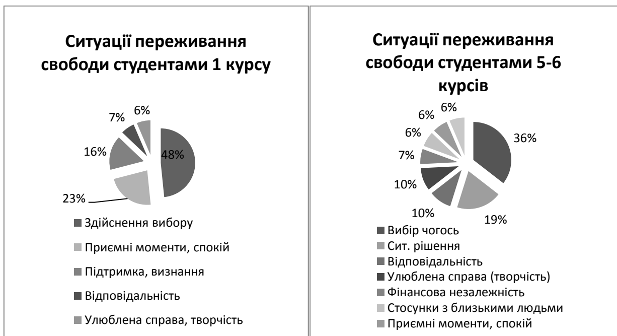
Рис.2. Ситуації переживання внутрішньої свободи студентами 1-го та 5-6 курсів

Ситуації переживання внутрішньої свободи студенти 1-го курсу описують як: здійснення вибору – 48%; приємні моменти, спокій – 23%; підтримка, визнання – 16%; відповідальність – 7%; улюблена справа, творчість – 6%. Студенти 5-6 курсів описують ситуації переживання внутрішньої свободи так: ситуація вибору – 26%; ситуація рішення – 14%; відповідальність – 7%; улюблена справа та творчість – 7%; фінансова незалежність – 5%; стосунки з близькими людьми, друзями – 5%; наодинці – 5%; приємні моменти, спокій – 5%; контроль над ситуацією – 5%. Результати наочно подані у діаграмах (див. рис. 2).